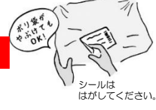
シールは はがしてください。

リサイクル事業を推進することによりその利益を環境問題改善に充てるのが可能になります。特に紙でできた卵パックのモールドパックに関しては、通常のパックより2~3倍の価格なのですが、カタログ回収で得た資金を補填することで生産者と組合員共に負担を軽減しながら環境問題に取り組むことができます。是非、リサイクルへのご協力をおねがいたします。 ※新聞や雑誌などの回収はできません!カタログ以外も含め、コープ自然派でお届けしたもののみを回収します。