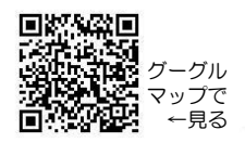
グーグルマップで 一看る